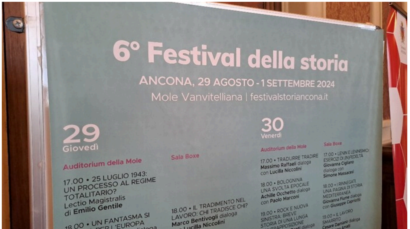
Festival della Storia 2023: esplorare il tema dei tradimenti ad Ancona dal 29 agosto al 1 settembre - Gaeta.it