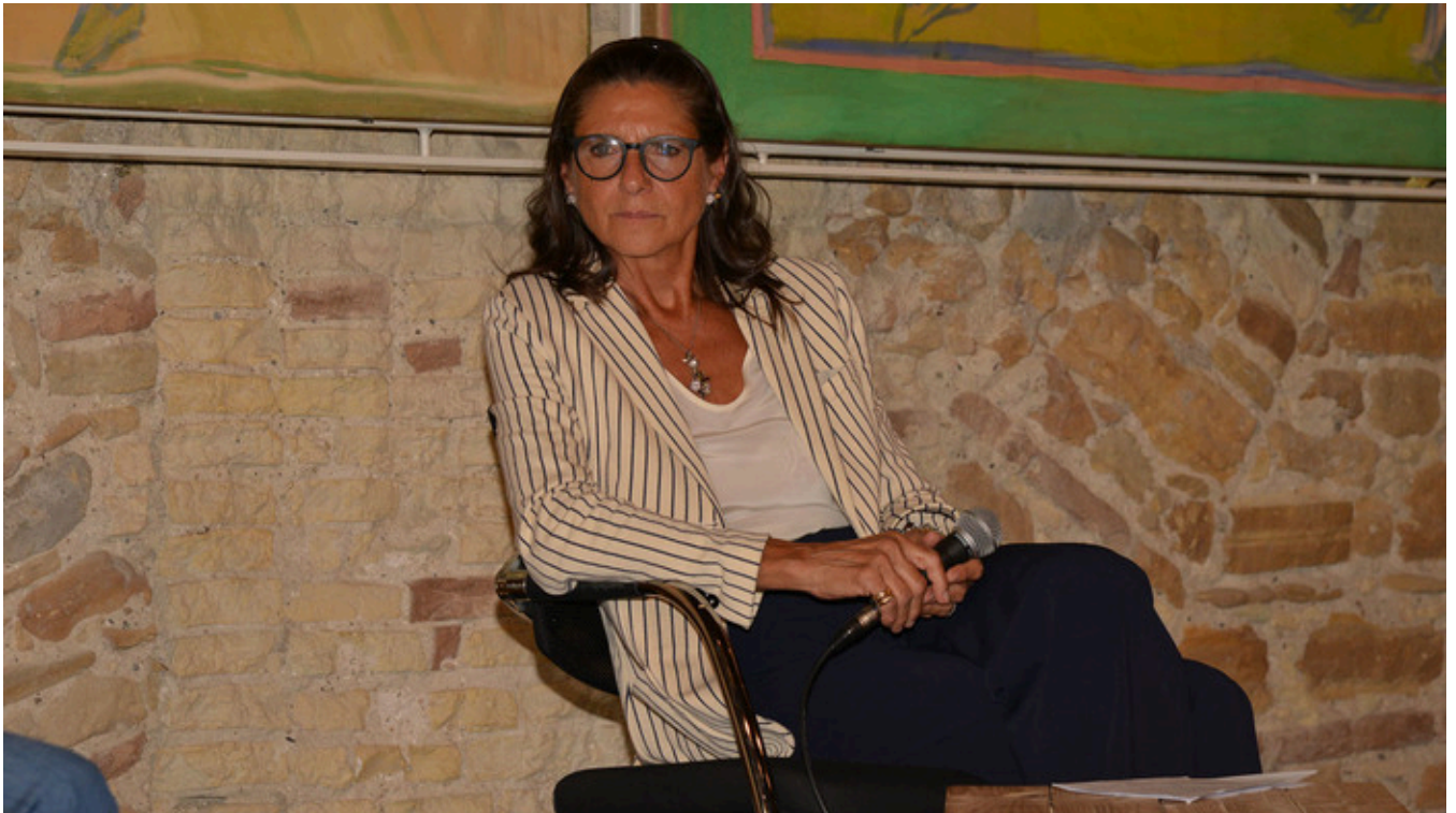
Festival della storia 2023: dalla trasgressione ai tradimenti, un appuntamento culturale ad Ancona - Gaeta.it